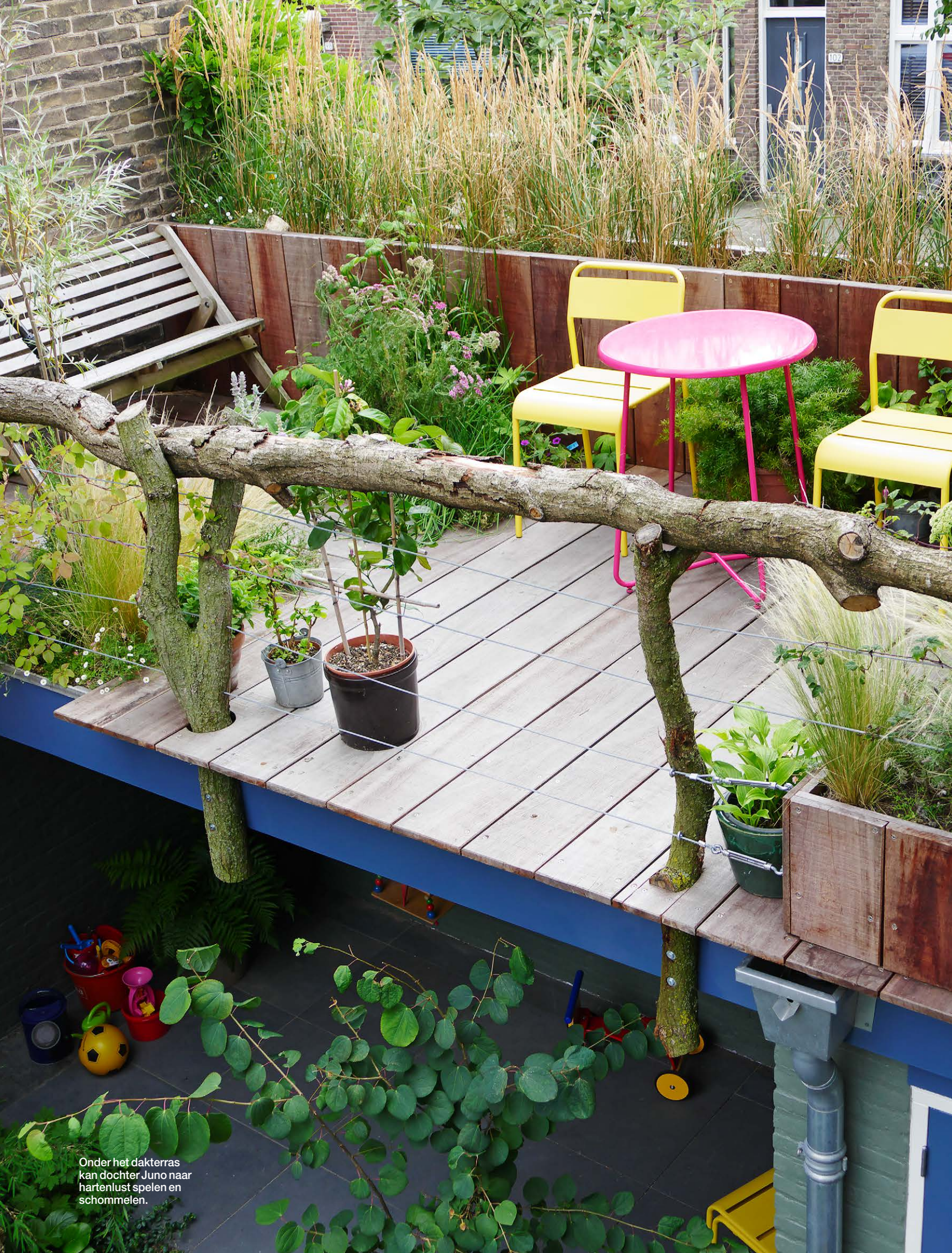
Onder het dakterras kan dochter Juno naar hartenlust spelen en schommelen.